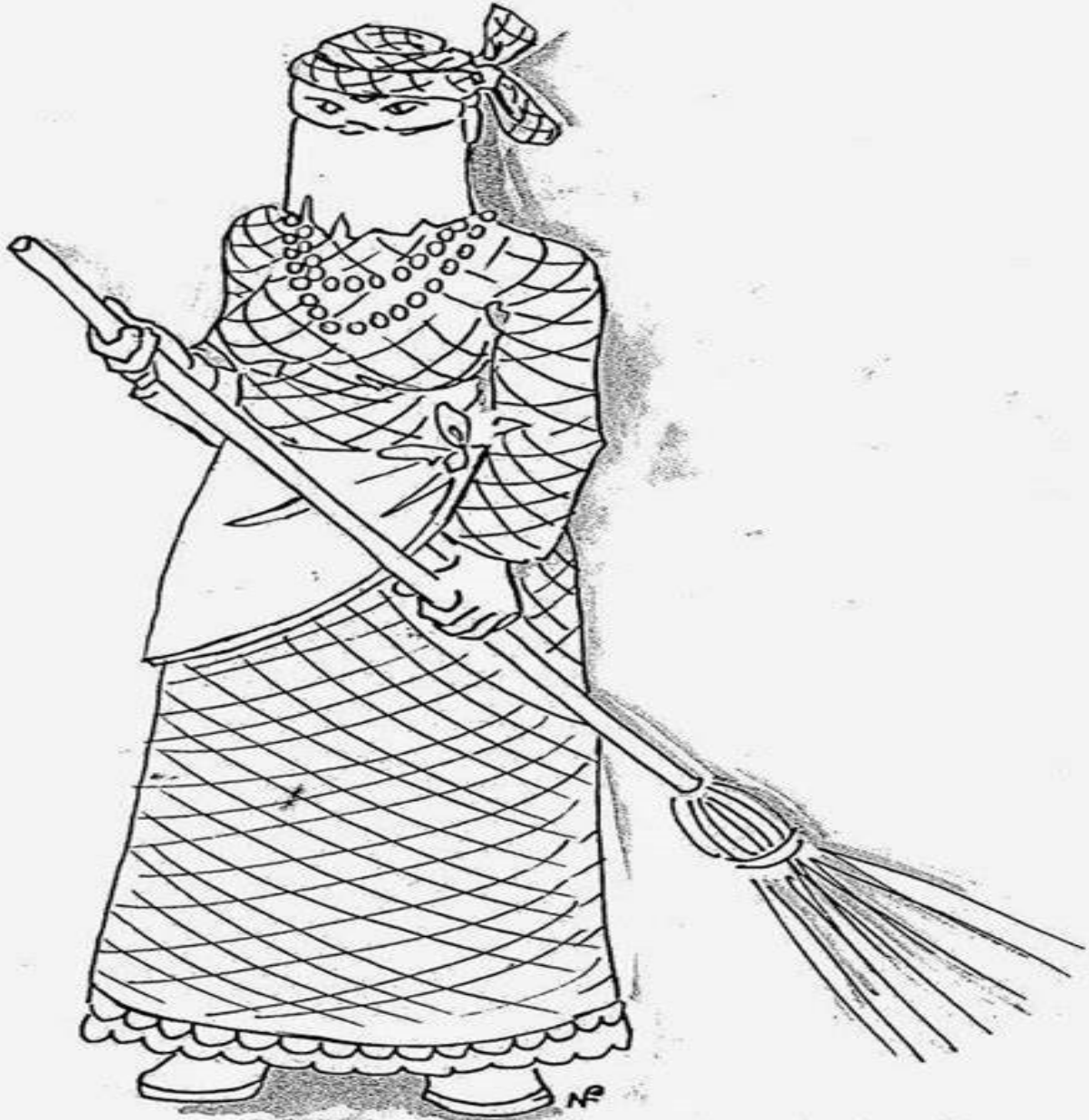
« Balayeuse »